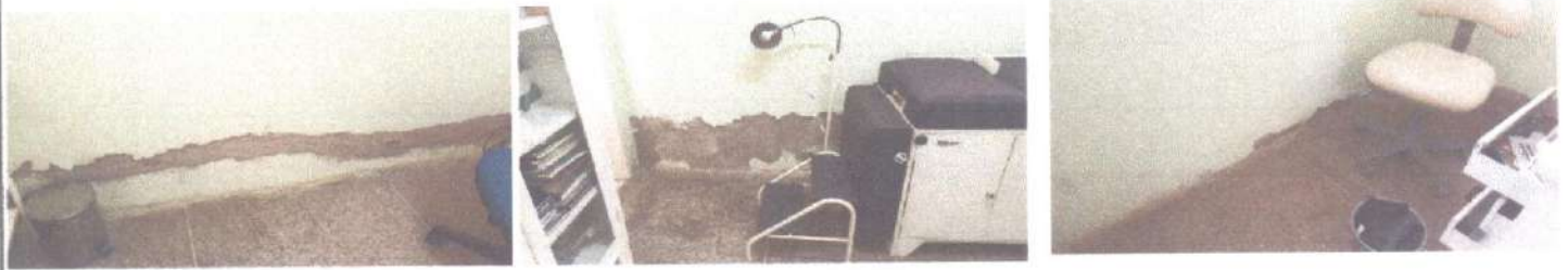
RECUPERAÇÃO DE REBOCO