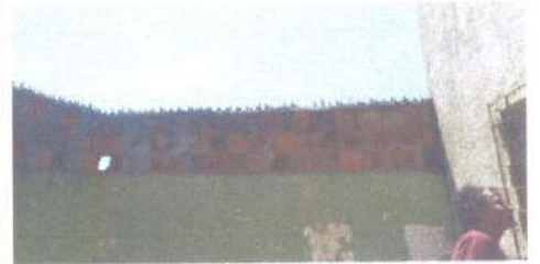
ADEQUAR OS DEGRAUS DA ESCADA E RAMPA DE ACESSO, COLOCAÇÃO DE GUARDA CORPO, SUBSTITUIÇÃO DO COBOGO.