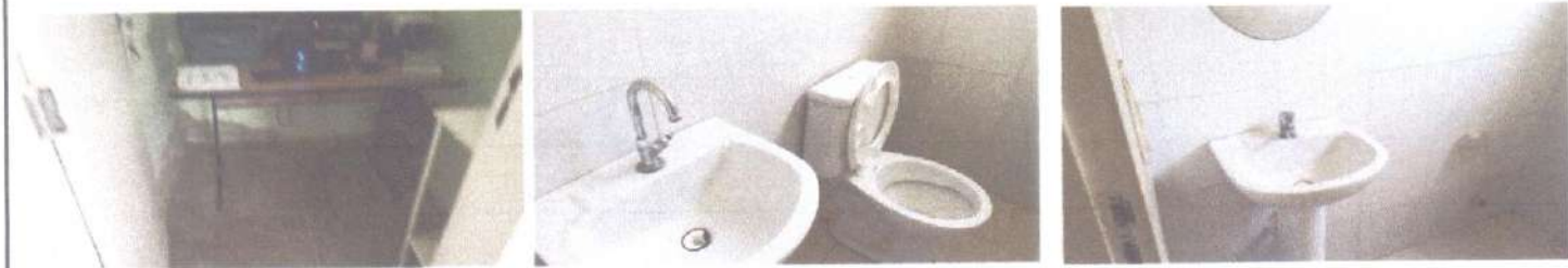
RECUPERAÇÃO DE REBOCO E SUBSTITUIÇÃO DE ESQUADRIAS DE MADEIRA, TROCA DE TORNEIRAS.