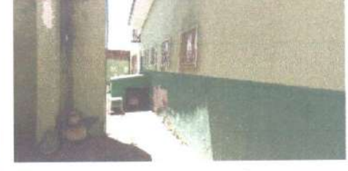
SERVIÇOS DE RECUPERAÇÃO DO REVESTIMENTO, CALÇADA, AUMENTAR A ALTURA DO MURO DOS FUNDOS, TROCA DA CAIXA D'ÁGUA.