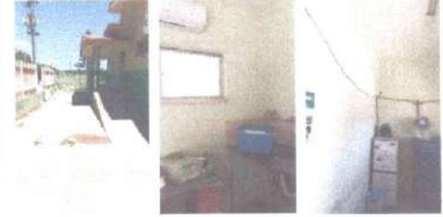
RECUPERAÇÃO DE REBOCO E IMPERMEABILIZAÇÃO DE PAREDES, ELEVÇÃO DO E TROCA DA CAIXA D'ÁGUA.