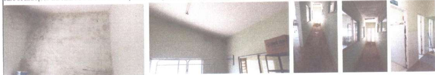
RECUPERAÇÃO DE REBOCO E SUBSTITUIÇÃO DE ESQUADRIAS DE MADEIRA.