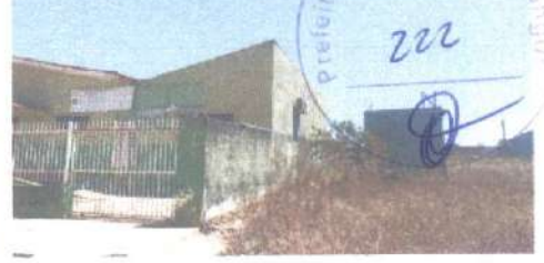
SERVIÇOS DE RECUPERAÇÃO DE CALÇADA, RAMPA DE ACESSO, GRADIL E FACHADA.