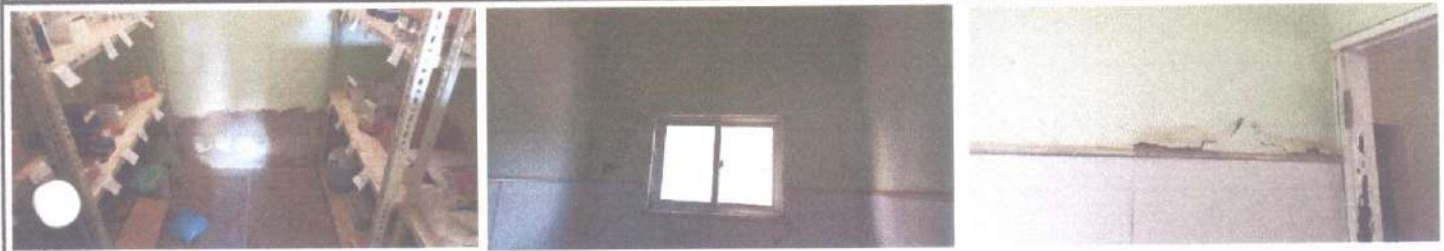
RECUPERAÇÃO DE REBOCO E SUBSTITUIÇÃO DE ESQUADRIAS DE MADEIRA.