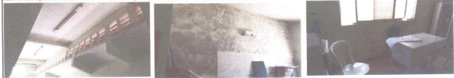
RECUPERAÇÃO DE REBOCO E SUBSTITUIÇÃO DE ESQUADRIAS DE MADEIRA.