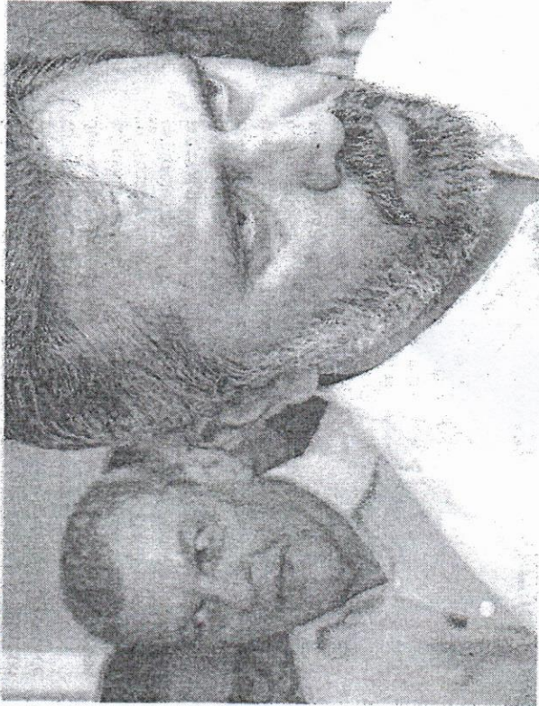
EVENTO de entrega de moradias

Estado do Ceará – Prefeitura Municipal de Viçosa do Ceará – Aviso de Licitação. A Pregoeira do Município de Viçosa do Ceará comunica que no próximo dia 14 de junho de 2023, às 05:00h, estará abrindo licitação na modalidade Pregão Presencial nº 01/2023-SEAGRI, cujo objeto será a aquisição de 100 unidades de caixa d'água de 180 litros, para o Mercado Público Central e dos boxes do Mercado José Pacheco de Siqueira do Município de Viçosa do Ceará. O edital estará à disposição dos interessados nos dias úteis após esta publicação nos sites: licitacoes.tce.ce.gov.br; viçosa.ce.gov.br/licitacoes e no horário de 08:00 às 12:00h e de 14:00h às 17:00h, na Rua José Joaquim de Carvalho, nº 473, Centro, Viçosa do Ceará/CE, em 26 de maio de 2023.