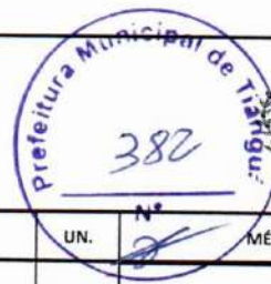
TABELA SEINFRA - 027.1 DESONERADA / SINAPI 04/2023