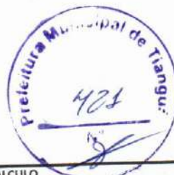
TABELA SEINFRA - 027.1 DESONERADA