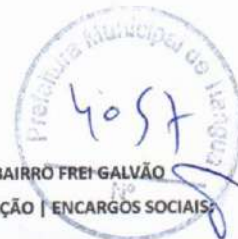
TABELA DE ENCARGOS SOCIAIS - SEINFRA

FONTE: SEINFRA 27.1- COM DESONERAÇÃO | ENCARGOS SOCIAIS 83,85% (HORA) 47,76% (Mês) | SINAPI-CE 04/2023 SEM DESONERAÇÃO | ENCARGOS SOCIAIS 114,15% (HORA) 71,31% (Mês)| BDI: 28,84%