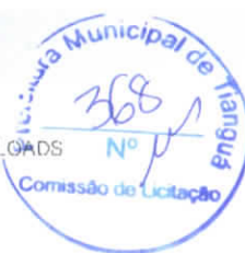
Tabela de Custos - Versão 024.1