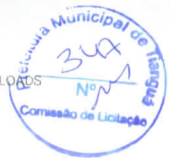
Tabela de Custos - Versão 024.1