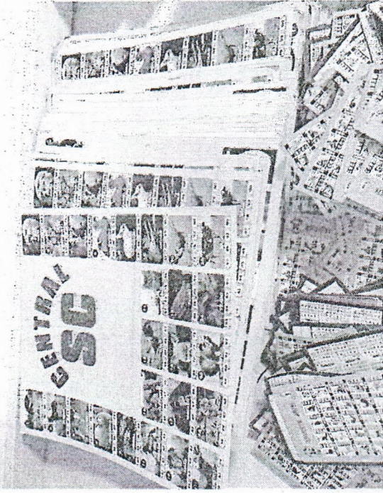
MATERIAL DO "Jogo do Bicho" foi apreendido durante a operação

Foram cumpridos 22 mandados de busca e apreensão em