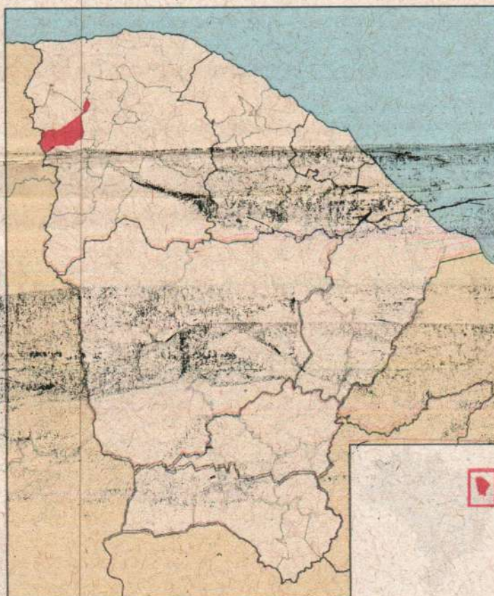
Figura 1 – Mapa de localização do município de Tianguá

O município de Tianguá, situa-se na Região Centro do Estado do Ceará, limitando-se ao Norte com os Municípios: Moraújo, Granja e Viçosa do Ceará; Sul: Ubajara; Leste: Ubajara, Frecheirinha, Coreau e Moraújo e a Oeste: Viçosa do Ceará e Estado do Piauí (Figura 1). Além do distrito Sede, Tianguá conta ainda com os distritos de Arapá, Caratuai, Pintogubá, Tabainha, Itaguaruna, Bela Vista e Acarape.