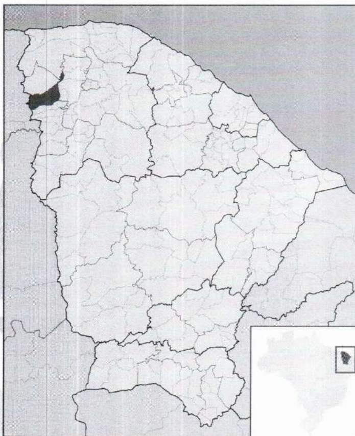
Figura 1 – Mapa de localização do município de Tianguá

O município de Tianguá, situa-se na Região Centro do Estado do Ceará, limitando-se ao Norte com os Municípios: Moraújo, Granja e Viçosa do Ceará; Sul: Ubajara; Leste: Ubajara, Frecheirinha, Coreaú e Moraújo e a Oeste: Viçosa do Ceará e Estado do Piauí (Figura 1). Além do distrito Sede, Tianguá conta ainda com os distritos de Arapá, Caratuai, Pintoguabá, Tabainha, Itaguaruna, Bela Vista e Acarape.