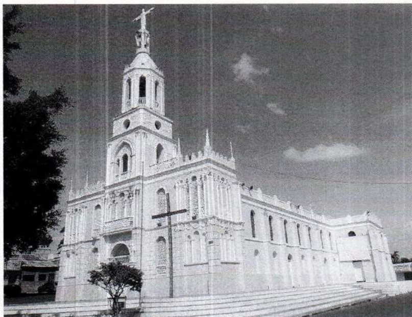
Figura 2 – Igreja da Matriz no centro de Tianguá