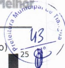
Mapa de Calor de Risco (Probabilidade x Impacto)