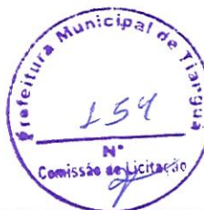
TABELA SEINFRA - 026.1 DESONERADA