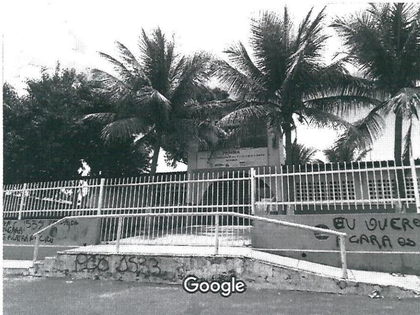
Captura da imagem: mar. 2020 Images may be subject to copyright. ©