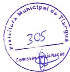
TABELA SEINFRA - 026.1 DESONERADA