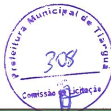
TABELA SEINFRA - 026.1 DESONERADA