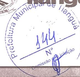
TABELA SEINFRA - 026.1 DESONERADA