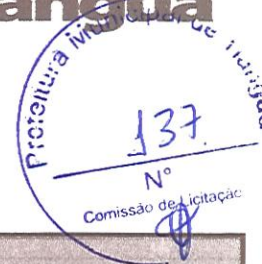
TABELA SEINFRA - 026.1 DESONERADA