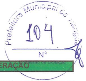
TABELA SEINFRA - 026.1 COM DESONERAÇÃO / SEINFRA-ANP (VERSÃO 2021/02)