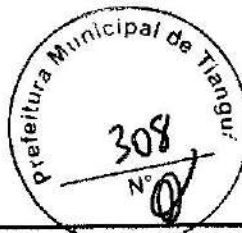
TABELA SEINFRA - 027.1 DESONERADA