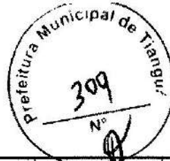
TABELA SEINFRA - 027.1 DESONERADA