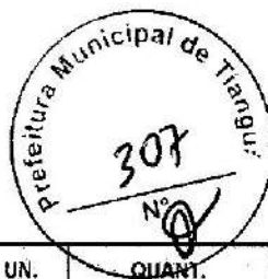
TABELA SEINFRA - 027.1 DESONERADA