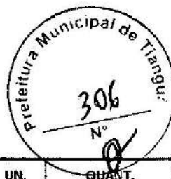
TABELA SEINFRA - 027 1 DESONERADA