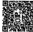
Apoie a câmera do celular e acesse mais notas exclusivas de Carlos Mazza.

Dois dias depois da fala do ex-ministro, a governadora fez publicação nas redes sociais minimizando pesquisas de opinião e defendendo que os aliados sejam ouvidos no processo. "Para além de pesquisa, que fornece apenas o retrato do momento, a mais de três meses da eleição, penso que é preciso ter sempre em mente que o amplo diálogo e a união de forças têm sido fundamentais para o Ceará seguir".