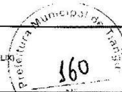
TABELA SEINFRA - 027.1 DESONERADA