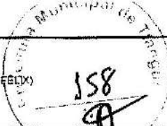
TABELA SEINFRA - 027.1 DESONERADA